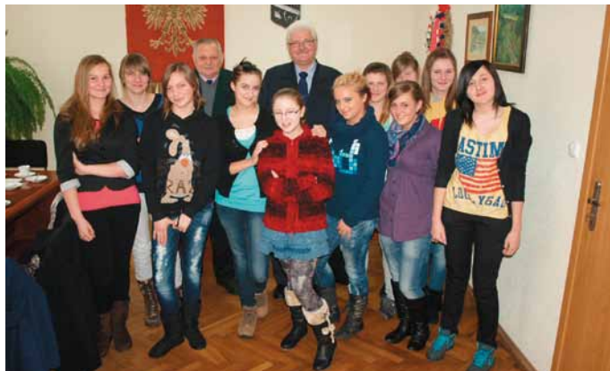
Szczipiomistki złożyły niedawno wizytę władzom gminy Radziechowy-Wieprz.

O tym, jak wyglądają mecze i treningi, a przede wszystkim wyniki dziewcząt, można się dowiedzieć ze stron internetowych: www.recznawieprz.bnx.pl , www.reczna-wieprz.blog.onet.pl