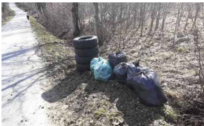
Sprzątnięcie w Radziechowach