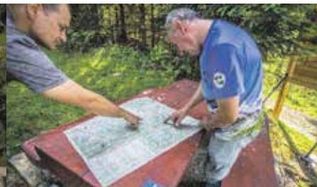
Cztery takie miejsca odpoczynku pojawiły się na ścieżce spacerowej w rejonie Słowianki. Zachęcają do nieoczywistych szlaków dla pieszych wędrowek.