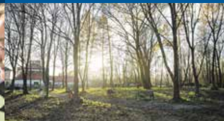
A w wolnej chwili zapraszamy na spacer po łąkach nad Sołą. Zrobiło się tam naprawdę ładnie.

OD 3 LAT ŻYWIEC ZDRÓJ S.A. WSPIERA LOKALNE INICJATYWY SPOŁECZNE.