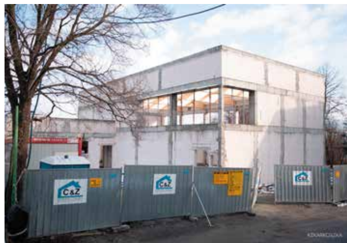
Budowa sali gimnastycznej w Przybędzy

Prace te, z uwagi na konieczność dobrych warunków pogodowych zaplanowano dopiero na wiosnę, po ustabilizowaniu się warunków pogodowych. Obie sale buduje firma C&Z Caputa i Zajęc Sp. zoo. z Leśnej k Żywca.