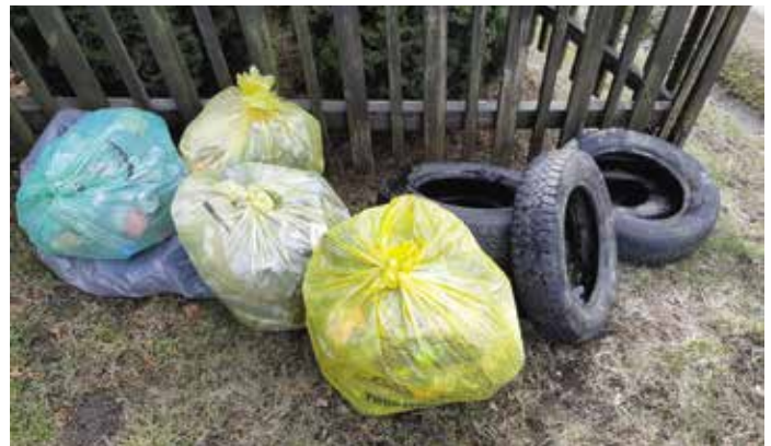
Sprzątnięcie w Brzuśniku