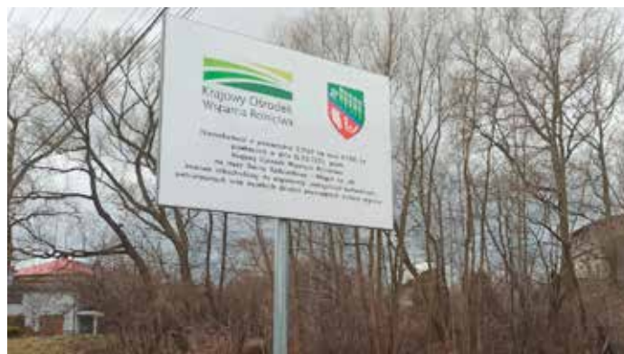
Tablica informująca o przekazaniu nieruchomości przez KOWR

- Przed nami również zadanie polegające na modernizacji kolejnych dróg gminnych oraz prace związane z pozimowym remontem na-