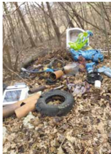
Sprzątnięcie w Przybędzy