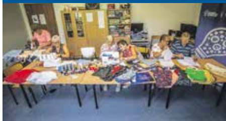
Ekologiczne torby na zakupy są dziś modowym hitem w gminie. Przydatne, stylowe i bardzo ekologiczne.