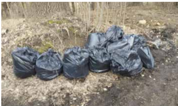
Sprzątnięcie w Przybędzy