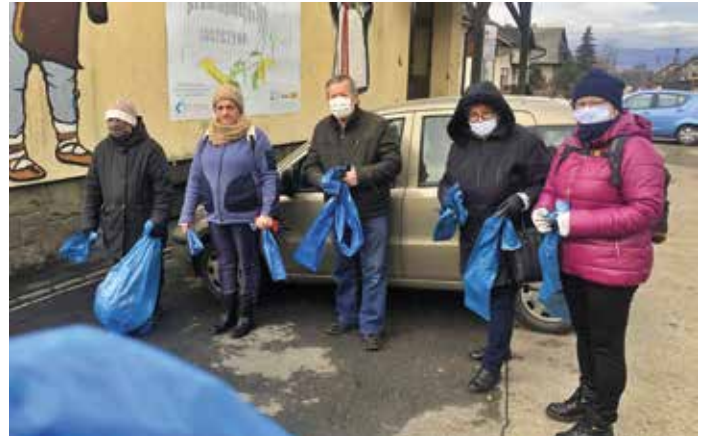
Seniorzy w Juszczyźnie w trakcie akcji sprzątnięcia

Do dzieła! Ratujmy siebie i swoje małe ojczyzny.