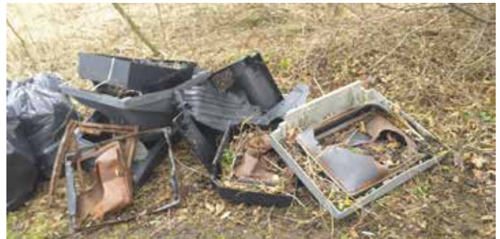
Sprzątnięcie w Bystrej