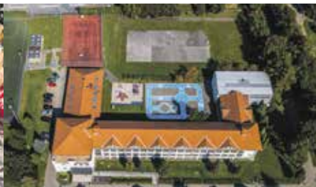
Z lotu ptaka: miasteczko ruchu drogowego przy SP w Węgierskiej Górcie. Od września dzieci uczą się tutaj i zdają egzamin na kartę rowerową.