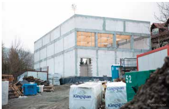
Budowa sali gimnastycznej w Bystrej

Zakończono już prace murarskie i żelbetowe związane z budową ścian, stropów i schodów. Wykonano także drewniane konstrukcje dachów sal gimnastycznych. Następnym krokiem budowy będzie wykonanie pokrycia dachowego.