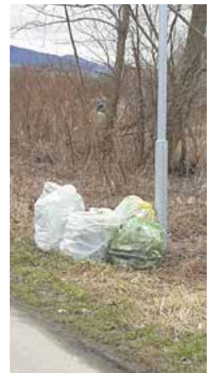
Sprzątnięcie w Wieprzu