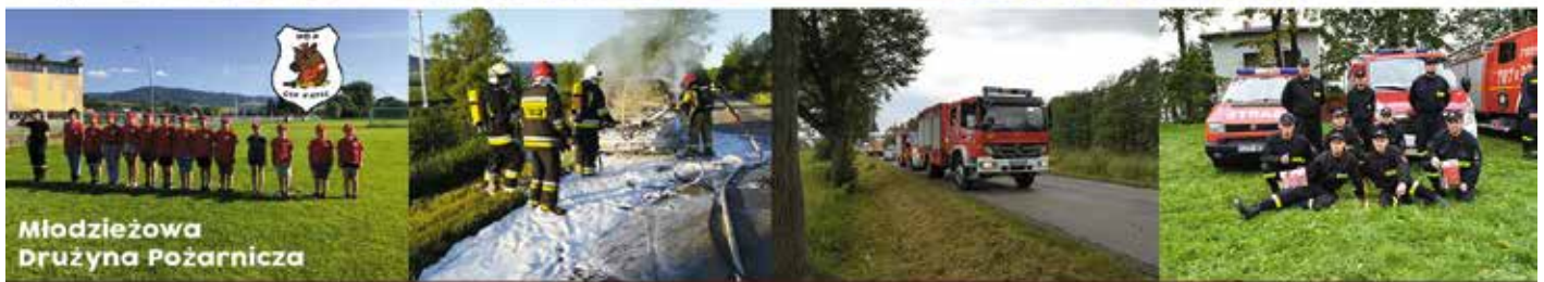
Młodzieżowa Drużyna Pożarnicza