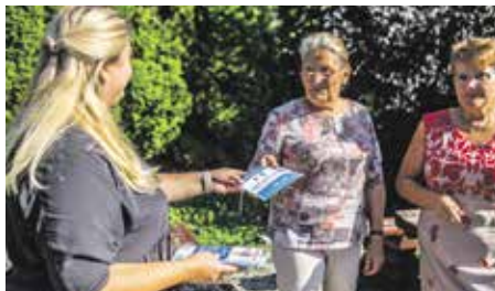
Rozdano ich już w gminie blisko osiemset, głównie seniorom. Te koperty mogą uratować życie.