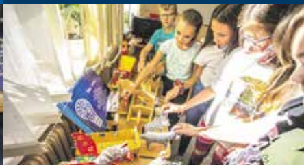
GOK w Jeleśni realizował projekt związany z wykonywaniem zabawek ludowych oraz tradycyjnym malarstwem na szkle.