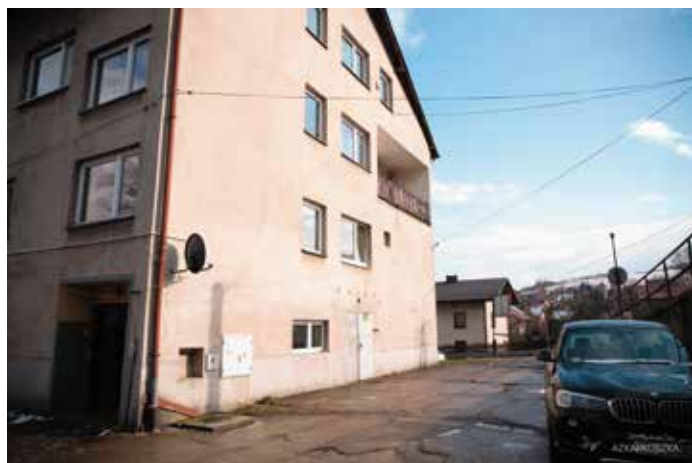
Ściana budynku przeznaczona do budowy szybu

Niebawem rozpocznie się wyczekiwany remont budynku Ośrodka Zdrowia przy ulicy św. Marcina 1301 w Radziechowach, którego celem jest przystosowanie budynku do potrzeb osób niepełnosprawnych.